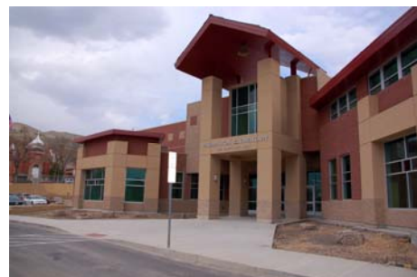
Escuela Primaria Washington

y vecinos. Los resultados representan diseños innovadores que reflejen las personalidades de los vecindarios individuales.